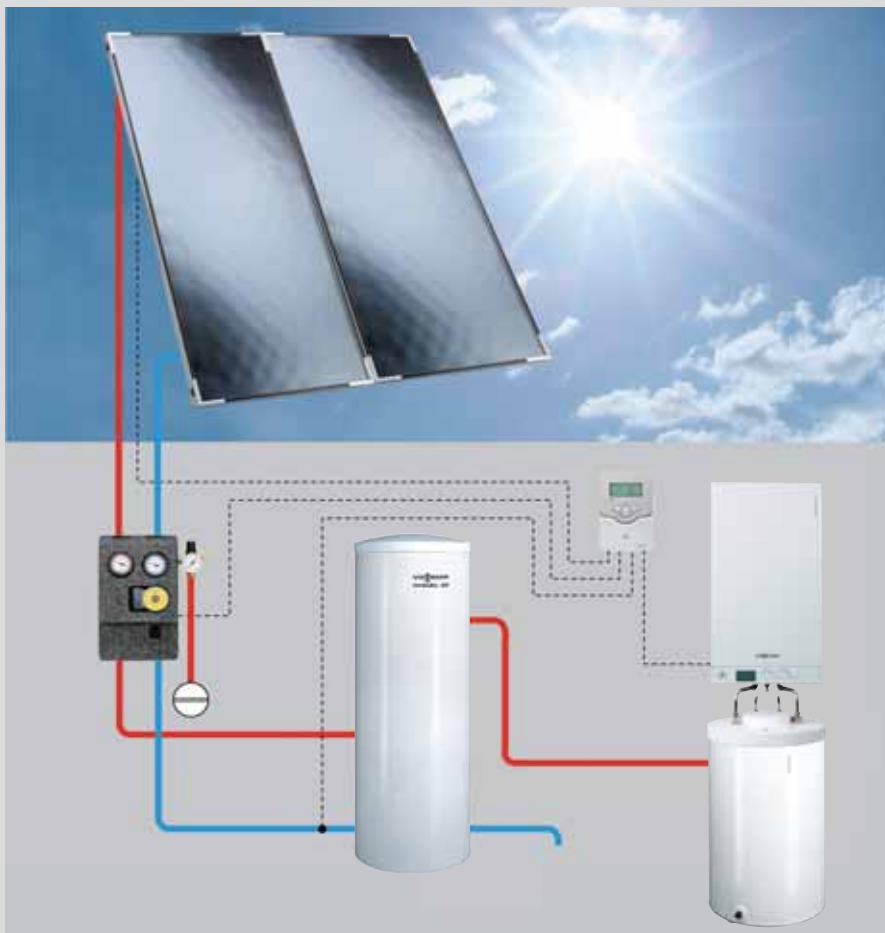
Optimálně sladěná systémová technika